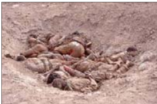
وقتی علم ایران صوری در جنگ زودن

از سوی دیگر در مقابل افزایش توطئه‌های رژیم‌های عرب و گسترش جنایات رژیم صهیونیستی، مقاومت نیز به پیروزی‌های چشمگیری نائل آمده است. با این وصف چرا نباید مقاومت تداوم یابد؟ امروز هیچ کسی نمی‌تواند به جوانان غزه بگوید که اسرائیل داوطلبانه از غزه خارج شده