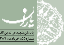
احمد جبریل - خالد مشعل