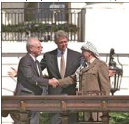
پاسخ عزالدین القسام برای قرار داد سلیم.

در آن شرایط شیخ عزالدین القسام دشمن اصلی را خوب