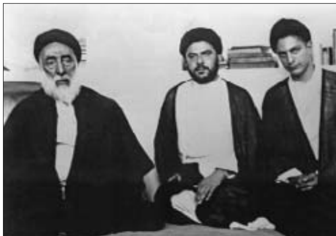
● از چپ: آیت الله العظمی سید صدرالدین صدر، آیت الله سید رضا صدر، امام موسی صدر.