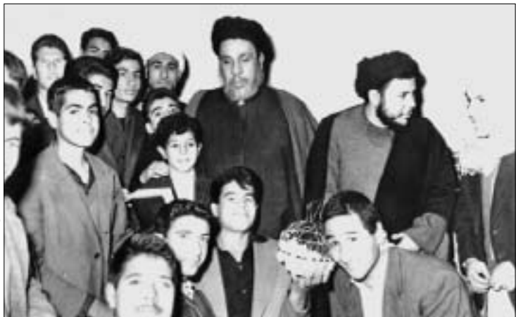
۱۳۴۴: نجف، شهید صدر در کنار برادر و دوستان و شاگردان.

در سال ۱۱۹۵ در جیل عامل به دنیا آمد. نزد پدرش و شیخ سلیمان بن معتوق و سید محسن کاظمی و سید علی طباطبایی و سید بحر العلوم و شیخ جعفر کاشف الغطاء درس خواند. با برادرش سید صدرالدین بن سید صالح همدان و هم میباحه بود و گویا مقام علمی او از برادرش صدرالدین بالاتر بوده؛ زیرا مجموعه‌ای دیده شده که سید صدرالدین مشکلات علمی را از او سؤال و پاسخهای او را در آن مجموعه یادداشت کرده است. وی از حیث زهد و ورع مقامی والا داشت و در مجلسی که وارد می‌شد با اینکه علمای بزرگ حضور داشتند، همگی مستمع تحقیقات و بیانات او بودند. وی برای زیارت مشهد رضوی با خانواده خود به ایران آمد و در اصفهان به منزل برادرش سید صدرالدین که در