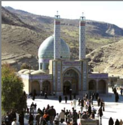
▲ امامزاده محمد عابر