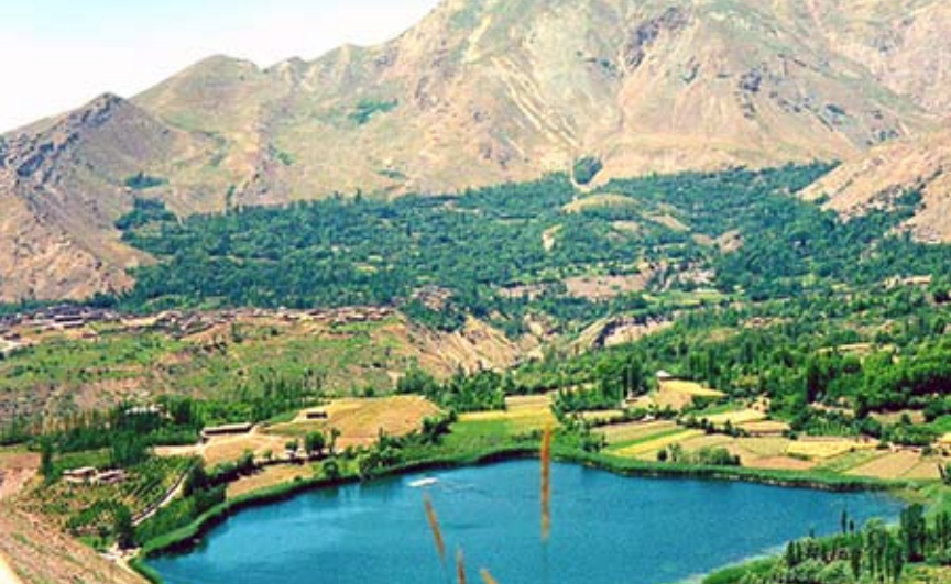
▲ ارکواز ملکشاهی