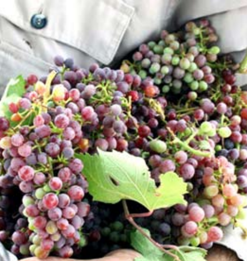
▲ انگور محصول روستای سرتنگ ملکشاهی