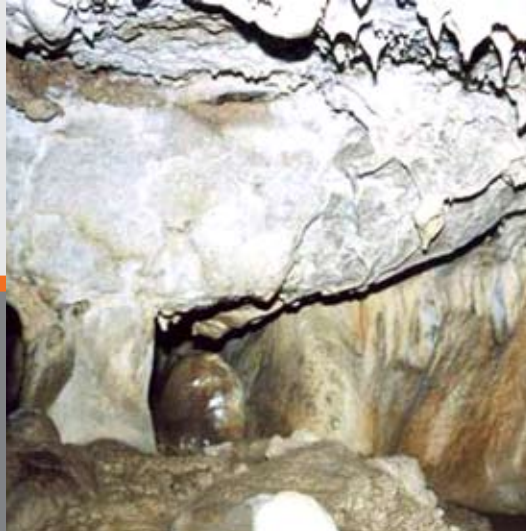
▲ غاز کان گنبد ملکشاهی