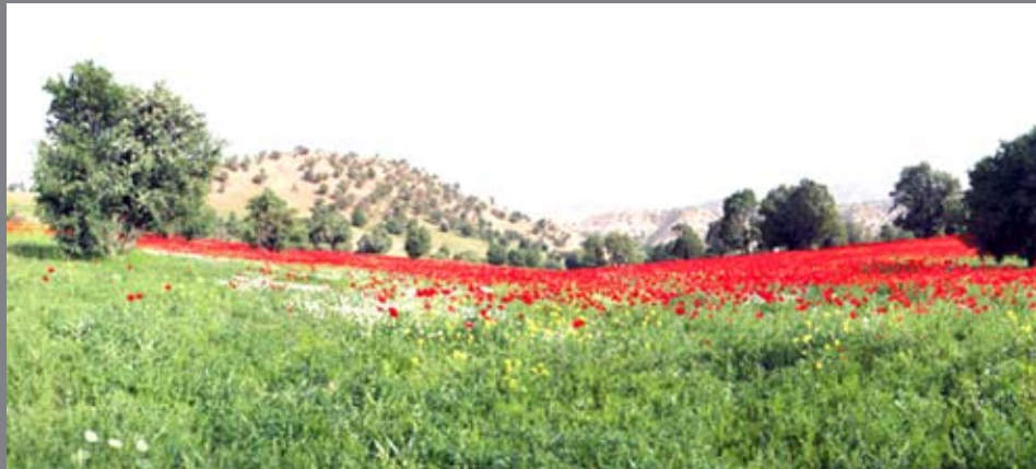
▲ دشت لاله دامنه کوه پشمین