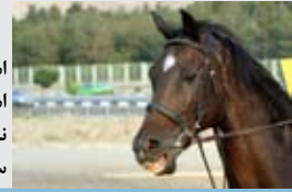
اسب‌ها شناسنامه دارند مثلاً این مشخصات شناسنامه یک اسب در باشگاه سمند است. نام: کدخدا - نام پدر: آفرود - نام مادر: شقایق - جنس: سیلیمی (نریان) - رنگ: کهر سوخته - تولد: ۱۹۷۱

باد می‌خورد و از چشم اشک می‌آید. یا دستکش مخصوص می‌خواست که من نداشتم و یکبار وقتی فرود آمدم و خواستم بال را کلم پیچ کنم در دستم خار رفت. برخی با خود تجهیزات ناپوری می‌آوردند که من ندارم و به حواس خود تکیه می‌کنم. مثلاً در ارتفاع هزار متری به سختی می‌توان تشخیص داد که آدم دارد اوج می‌گیرد یا پایین می‌آید. آدم به جای اینکه این چیزها را به خودش ببندد باید خودش را منطبق کند و قابلیت‌های خودش را بالا ببرد.