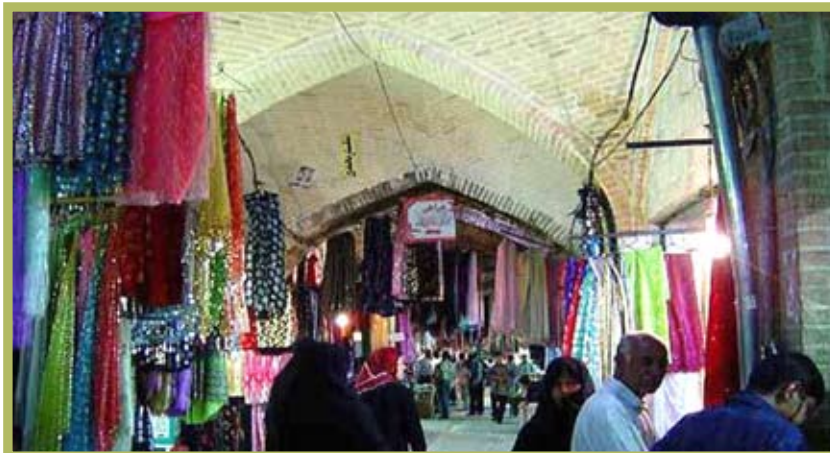
بازار سنتی کرمانشاه

این غار در دامنه غربی کوه شاهو در شهرستان پاره قرار دارد و از بزرگترین غارهای آبی آسیا و طولانی ترین غار ایران است.